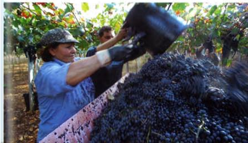
Bild linke Seite: die berühmten Trulli in Alberobello; rechte Seite von oben nach unten: traumhaft schöne Adriaküste, Barockkirche in Lecce, Weinlese.